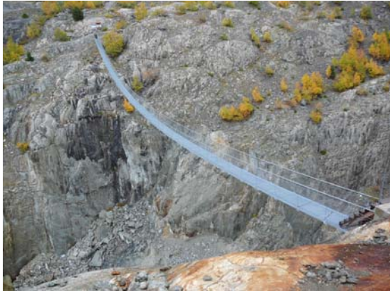
Hängebrücke zwischen Riederalp und Belalp

3 Workshops haben bereits in der Region Aletsch stattgefunden.