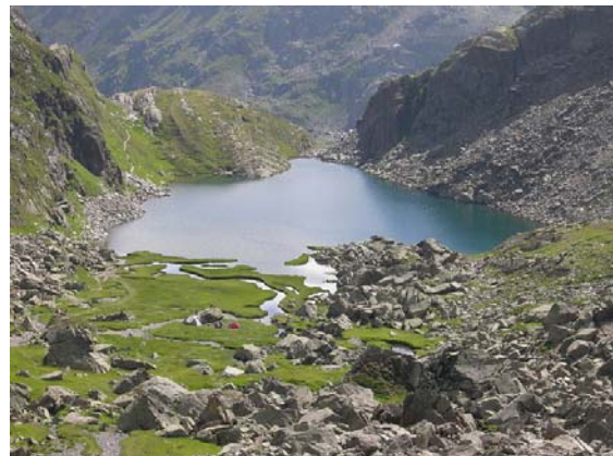
Lai di Tuma, die Rheinquelle

Um besonders den ersten Punkt etwas fundierter behandeln zu können, wurde von Seiten des Instituts für Tourismus- und Freizeitforschung der HTW Chur im Anschluss an diesen ersten Workshop eine soziale Netzwerkanalyse im Raum obere Surselva-Andermatt durchgeführt, wobei die entsprechenden Resultate den regionalen Akteuren dann am zweiten Workshop vorgestellt wurden.