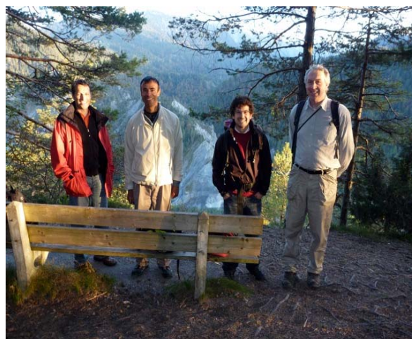
Die Rheinschlucht bei Flims (GR)

Das Projekt tritt nun in das letzte Jahr ein. Hier gilt es sowohl in den Pilotregionen als auch Schweizweit Akzente zu setzen, welche die überlebenswichtige Thematik «globaler Wandel» sowohl innerhalb der Reihen der Entscheidungsträger wie auch in der breiten Öffentlichkeit diffundieren. Die noch ausstehenden Workshops, eine Schweizer Schlussveranstaltung, sowie zahlreiche Publikationen werden dazu beitragen.