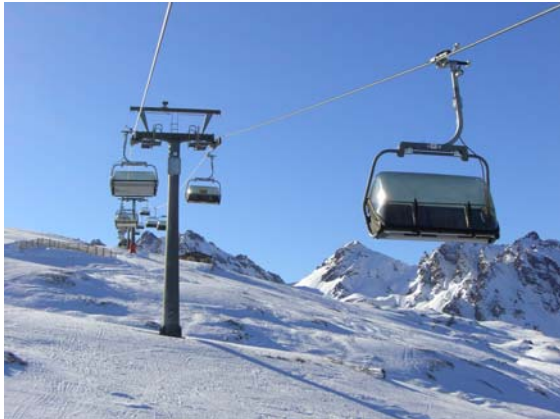
Das Skigebiet von Pizol

Ausgangslage des Pilotgebietes bildete eine der zentralen Erkenntnisse.